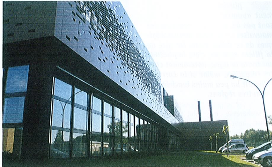
Les 1500 m 2 de la pépinière d'entreprises du Lunévillois, située sur le Pôle Lavoisier à Moncel-lès-Lunéville, devraient être opérationnels dans un peu moins d'un mois. L'inauguration officielle est annoncée pour le 29 septembre.

La peinture bleu marine est tout juste sèche sur les portes des futurs bureaux ! En sous-sol, les électriciens s'activent pour tirer les gaines de câbles dans les ateliers et les zones de stockage tandis qu'un de leur confrère s'affaire au premier étage dans ce qui sera bientôt la future pépinière d'entreprises du Lunévillois, au cœur de Pôle Lavoisier à Moncel-lès-Lunéville. 1500 m 2 de superficie où 23 bureaux (d'une surface allant de 15 à 40 m 2 ) et huit ateliers (de 50 à 140 m 2 ) vont prendre place à partir de début septembre sous la gestion du délégataire Sogequare, qui possède déjà sept pépinières de ce genre dans l'Est de la France, notamment dans l'agglomération nancéienne, sous le nom commercial de Quartier des Entrepreneurs.