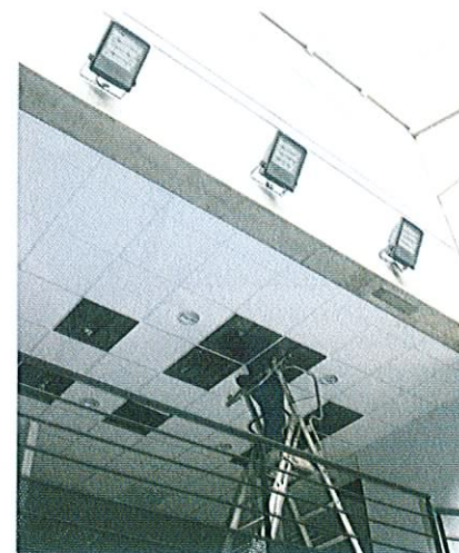
Les travaux vont bon train au cœur de cette nouvelle structure dont la commercialisation commencera début septembre

Le chantier de la future pépinière d'entreprises du pôle Lavoisier, sous la maîtrise d'ouvrage de la Commune de communes du Lunévillois et la maîtrise d'œuvre du cabinet d'architectes alsacien Archicub, s'affiche comme une opération où les entreprises régionales ont tiré leur épingle du jeu. La quasi-totalité est issue des quatre départements. Démolition : Est Démolition. VRD : Valentin Chiaravelli. Gros œuvre : Batico 88. Charpente métallique, couverture-étanchéité et bardage : EMB. Menuiserie extérieure : Alufey Briotet. Serrurerie : Schweitzer. Stores : Stores Design. Plâtrerie : IdéalCréation. Cloisons amovibles : Clestra. Menuiserie Bois : Méhuiprest. Portes sectorielles : BN France 2000. Revêtement souple et carrelage : Miller. Peinture : Rousseau.