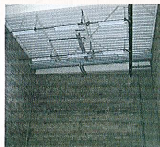
Huit ateliers et zones de stockage sont annoncés, d'une surface de 50 à 140 m 2 , avec une hauteur plus que conséquente.

Des zones de stockage allant de 50 à 140 m 2 avec une hauteur sous plafond plus qu'importante, le tout avec un quai de déchargement commun et utilisable par les futurs locataires. C'est l'une des offres de la future pépinière d'entreprises du Lunévillois. « Il est certain que proposer ce type de surface à la location est un plus indéniable pour ce genre de structure », assure Dominique Sacco de chez Sogequare, le gestionnaire de la pépinière. Chaque locataire aura un accès direct et sécurisé via un badge d'identification et pourra être en relation directe avec les bureaux à l'étage grâce à un dispositif de téléphone sans fil. Ces zones de mini-stockage peuvent également être utilisées comme des minis ateliers de fabrication. Cette offre devrait séduire notamment les professionnels du second œuvre du bâtiment souvent à la recherche de ce type de surface pour entreposer leurs matériaux. « Nous avons déjà une entreprise qui devrait nous prendre une zone dès l'ouverture en septembre prochain », continue le représentant de Sogequare. Au total, ce sont huit ateliers de ce type que proposera la future pépinière d'entreprises.