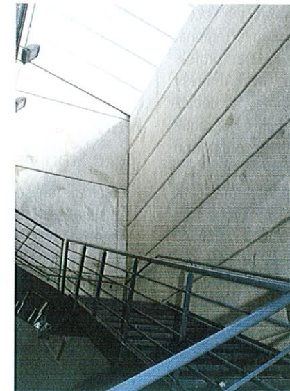
23 bureaux, de 15 à 40 m 2 de surface, seront proposés aux futurs locataires, sur deux étages.

« Les lieux de vie et les espaces communs sont très importants dans