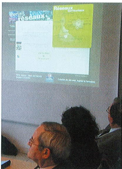
Le www.portaildesreseaux.com vient d'être lancé. Un nouvel outil pour une meilleure diffusion des acteurs de l'économie.

D u nouveau dans l'approche fédératrice des réseaux d'entreprises ! La Commission Rencontres Inter Réseaux de la CCI de Meurthe-et-Moselle vient de lancer un nouveau portail dans ce sens. Le www.portaildesreseaux.com devrait gagner l'ensemble du territoire régional.